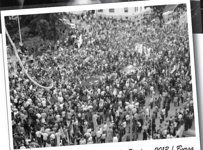
15 Haziran 2013 | Bursa

Ankara'da BDSP'liler Kızıl Bayrak satışı