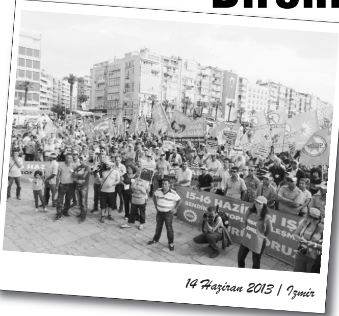
14 Haziran 2013 | İzmir

Büyük halk hareketinin yaşandığı tarihsel günlerin içerisinde denk gelen, 15-16 Haziran Büyük İşçi Direnişi anması, toplumsal katmanların mücadele deneyimlerini hatırlaması için oldukça anlamlı oldu. 43 yıl önce DİSK'in kapatılmasına karşı başlayan ve 2 gün süren büyük işçi direnişi, farklı illerde yapılan eylemlerle selamlandı.