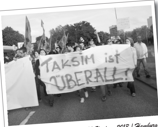
17 Haziran 2013 | Hamburg

Çadırın önünde toplanan yaklaşık bin kişilik öfkeli ve coşkulu kitle buradan merkezi İstasyon önüne bir yürüyüş gerçekleştirdi. Alevi kitlesinin yanı sıra, direnişle dayanışma ortak inisiyatifi ve yerli sol güçlerin de katıldığı yürüyüşte sloganlar öfkeyle atıldı.